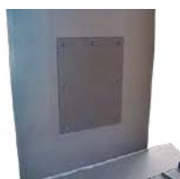
Trappe d'accès pour ramonage