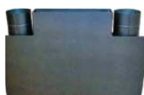
Sorties d'air chaud verticales